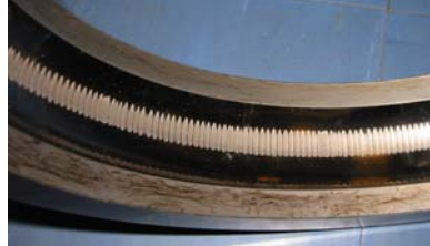
Gjennomskåret havarett kulelager

Trinnløs regulering av av elektromotorer blir stadig mer populært, grunnet det store energisparepotensialet denne teknikken representerer. Nye regler for energivennlige hus gjør teknikken enda mer aktuell, og en ser nå at de fleste nye prosjekt blir realisert ved bruk av frekvensomformere, det være seg VAV regulerte ventilasjonsanlegg, prosesspumperegulering, eller store elektriske drifter på skip og offshore. Det har dukket opp flere alvorlige problemområder knyttet til de tradisjonelle Puls Width Modulerte frekvensomformerene. Rapporter fra m.a. SKF viser at de m.a. skader kulelagerene i elektromotoren i stort omfang. Disse skadene, som fort kan medføre totalhavari av elektromotorene, kan inntreffe på alle typer motoreffekter- og ofte etter få måneders drift.